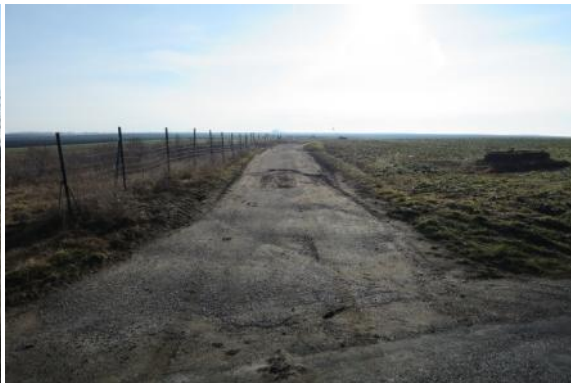
C45 - Ladná - Břeclav