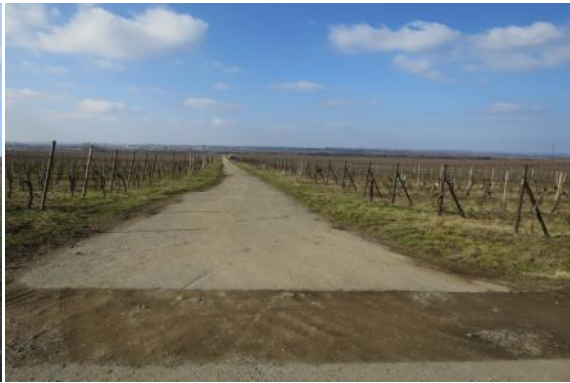
Trasa C23 - Hrušky - Tvrdonice