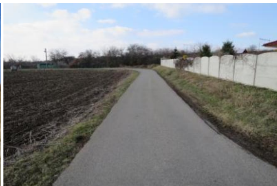
C24 - Moravská N. Ves - Týnec - Tvrdonice