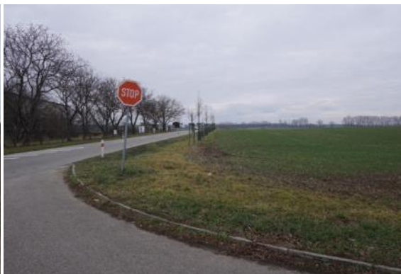
Trasa C2 - Benzina OMW - I/55 Lužice