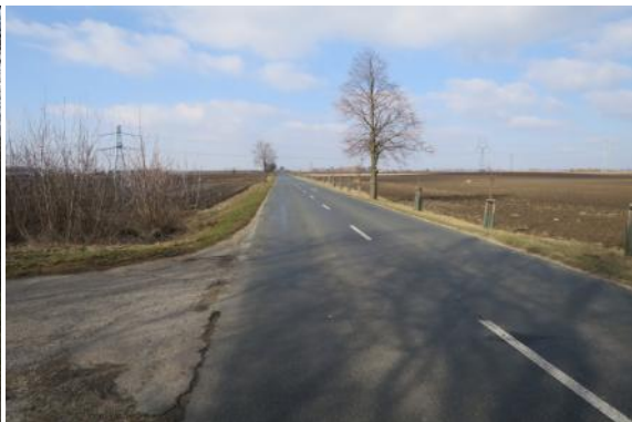
C43 - I/55 (Motocesta u Husára) - Hrušky