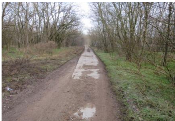
Trasa C3 - Lužice (Ploštiny) - Mikulčice