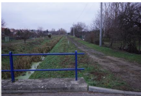
C52 - Nový Poddvorov - Větrný mlýn (Čejkovice)