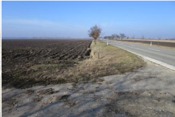
C37 - II/425 (benzinová stanice) - Lanžhot (kaple ve Hvězdách)