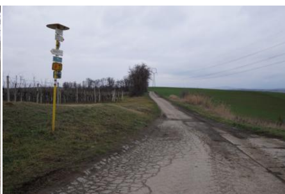
C55 = T19 - Nový Poddvorov - Průšánky