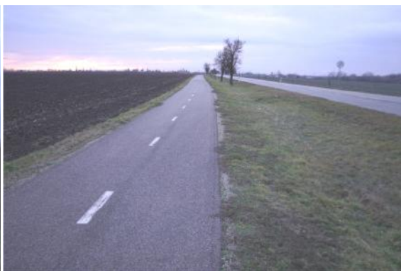
C58 = T22 - Dolní Bojanovice - Lužice