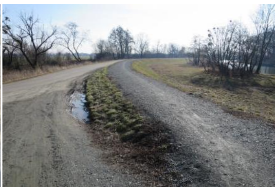
C46 - Starý Poddvorov - Dolní Bojanovice (cyklostezka T14=C56)