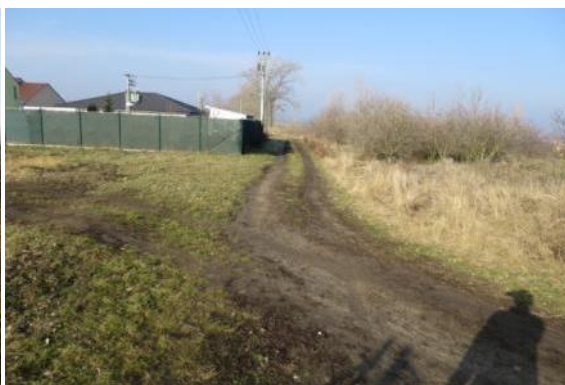
C27 - Tvrdonice - Kostice (Kyjovka)