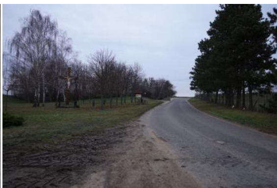
C56 = T14 - Dolní Bojanovice - Starý Poddvorov