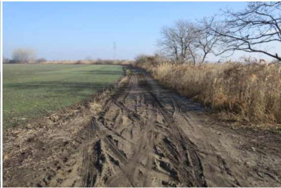
C33 - Železniční přejezd P3845 - Lanžhot