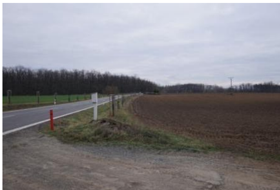
Trasa C1 - Dolní Bojanovice - I/55

Přílohou této kapitoly jsou fotodokumentace vybraných úseku jednotlivých tras.