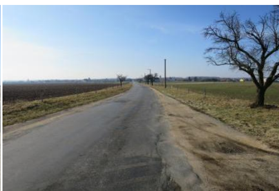
C48 - Moravský Žižkov - směr Přečov (Břeclavská)