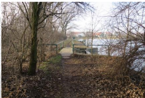
C50 - Moravský Žižkov - Nový Poddvorov